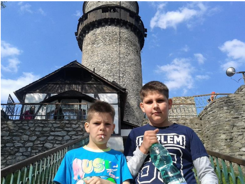
tři trúby (ne, jenom jedna!)