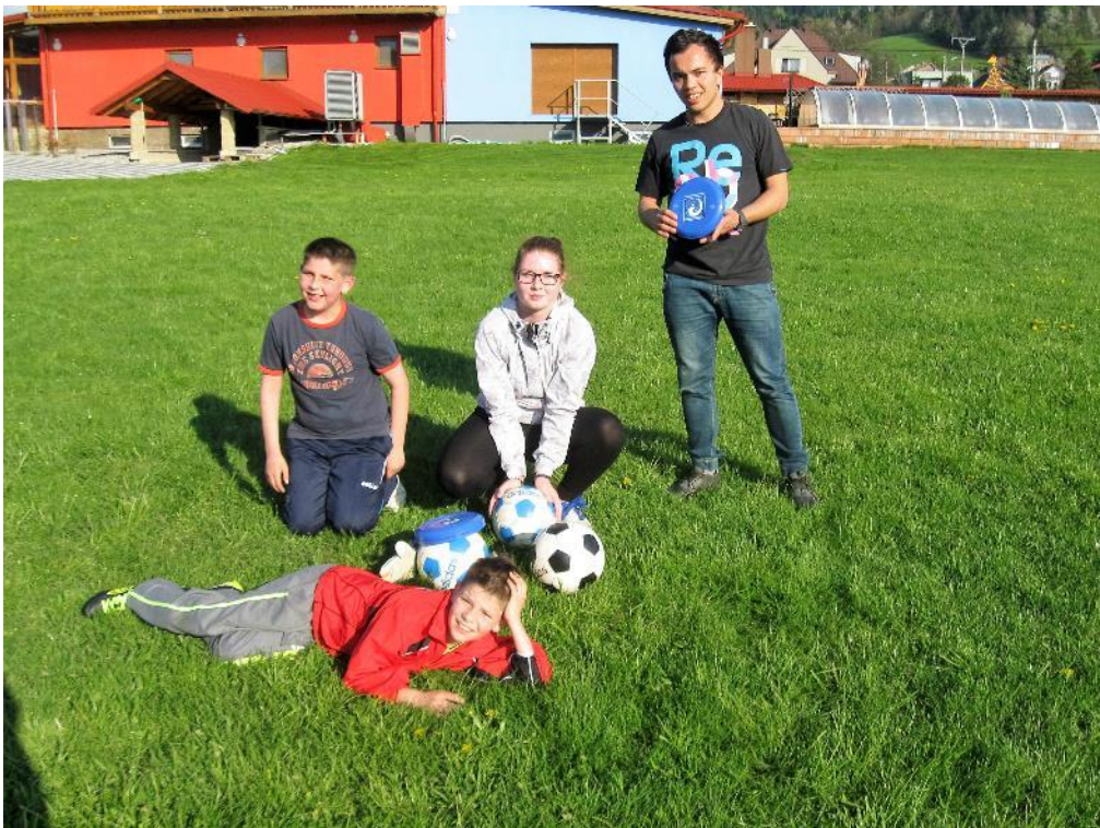
malý páteční trénink