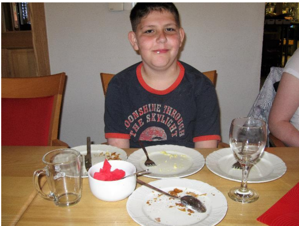
Taková normální snídaně