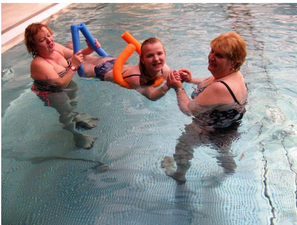
Monča zdokonaluje svůj styl – jenom, kdyby ty tety nezavazely