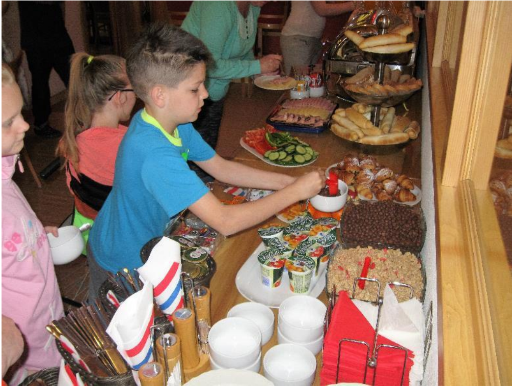
snídaňový bufet byl opravdu bohatý