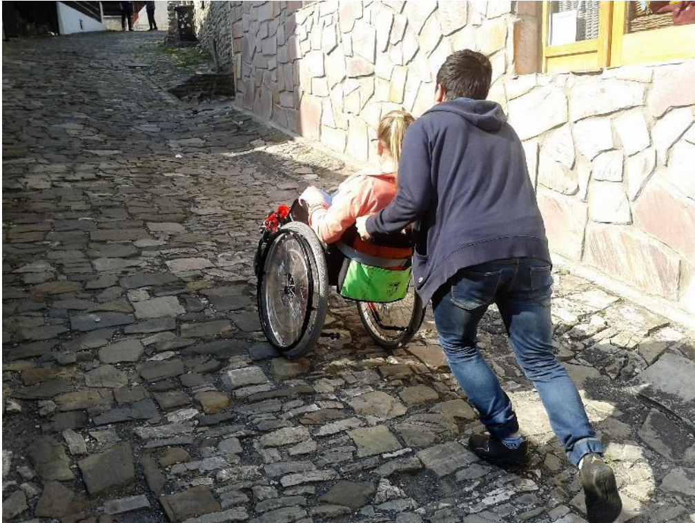
Honzo zaber, už tam budeme