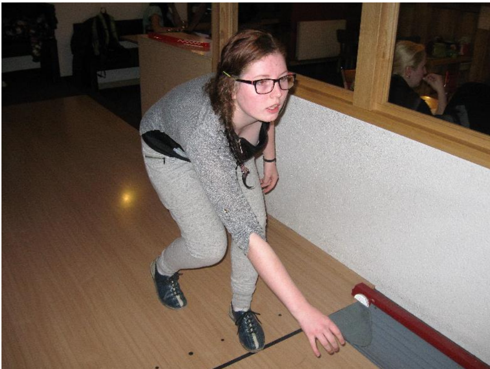
ted' to bude 10!