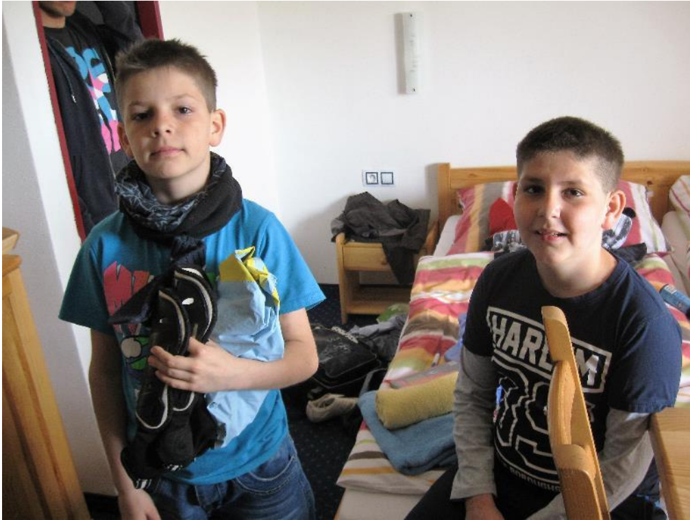
bráchové se vybalují