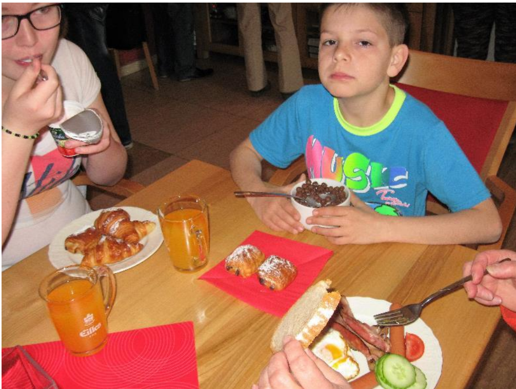
každý si vybral, na co měl chuť