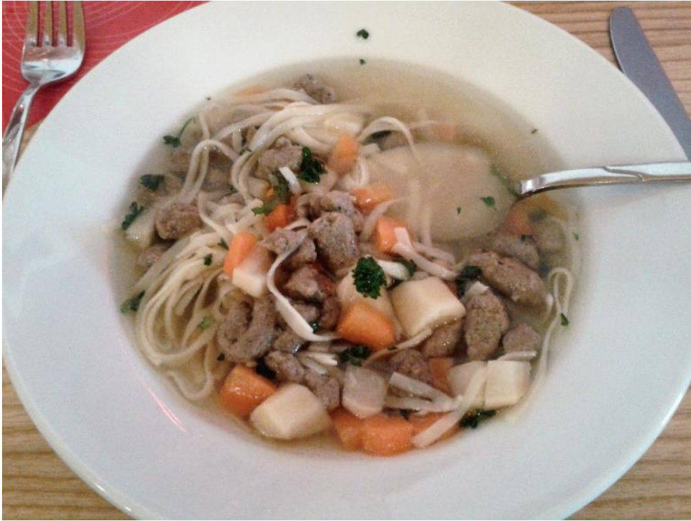
nedělní polévka s játrovými knedlíčky...