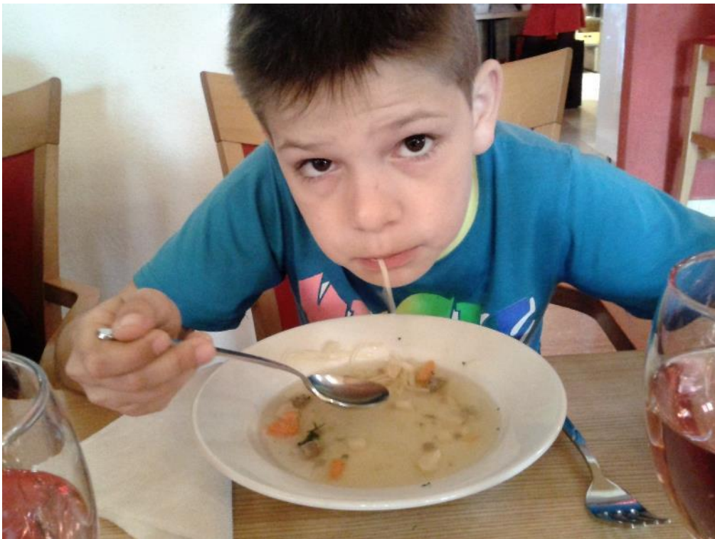
... byla opravdu dobrá

A pak už následovalo balení zavazadel, úklid pokojů a odjezd zpět do domova. Po celý pobyt byli všichni spokojeni a k sobě navzájem slušní. Moc se nám to líbilo, a když budeme hodní, tak příští rok možná pojedeme zas. Už teď se těšíme.