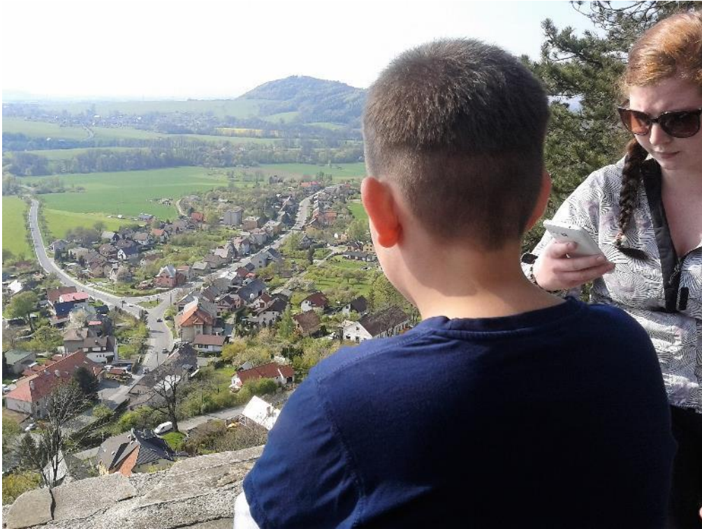
ten výhled za tu námahu stál