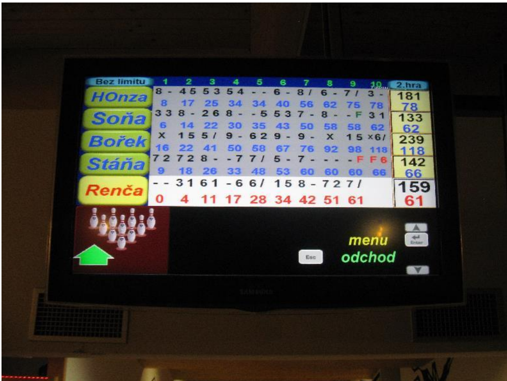
a vítězem je ... strejda!