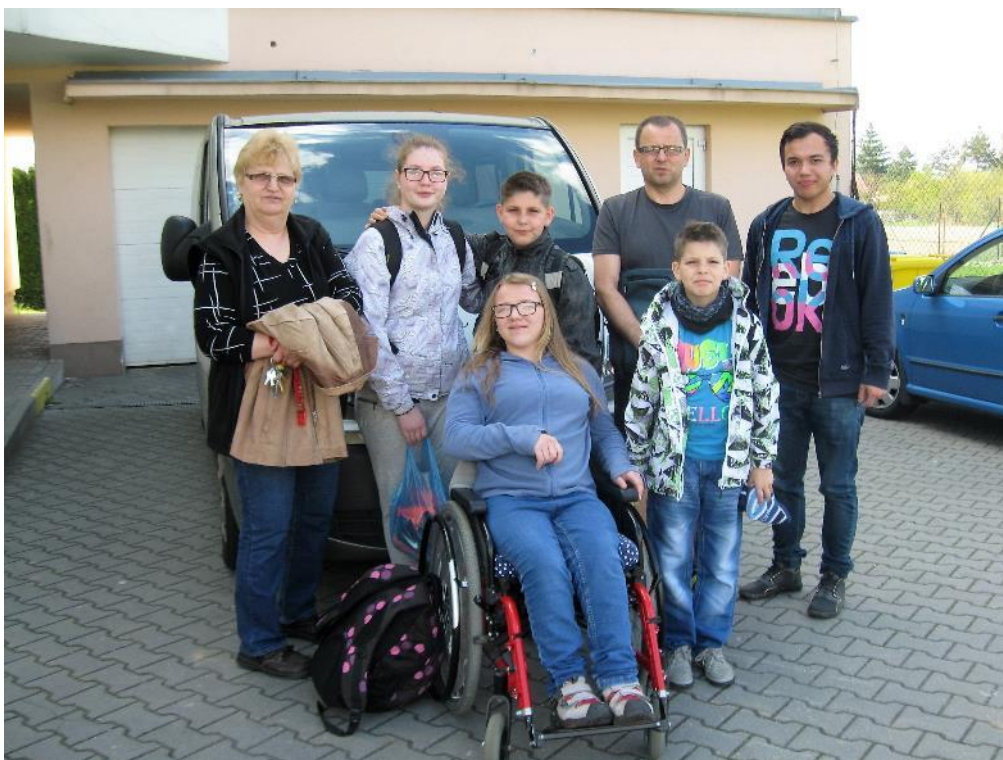
„Dvojka“ je připravena k odjezdu