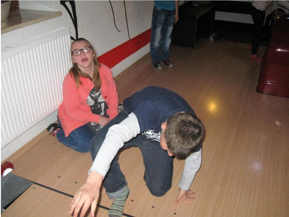
tak to je přešlap