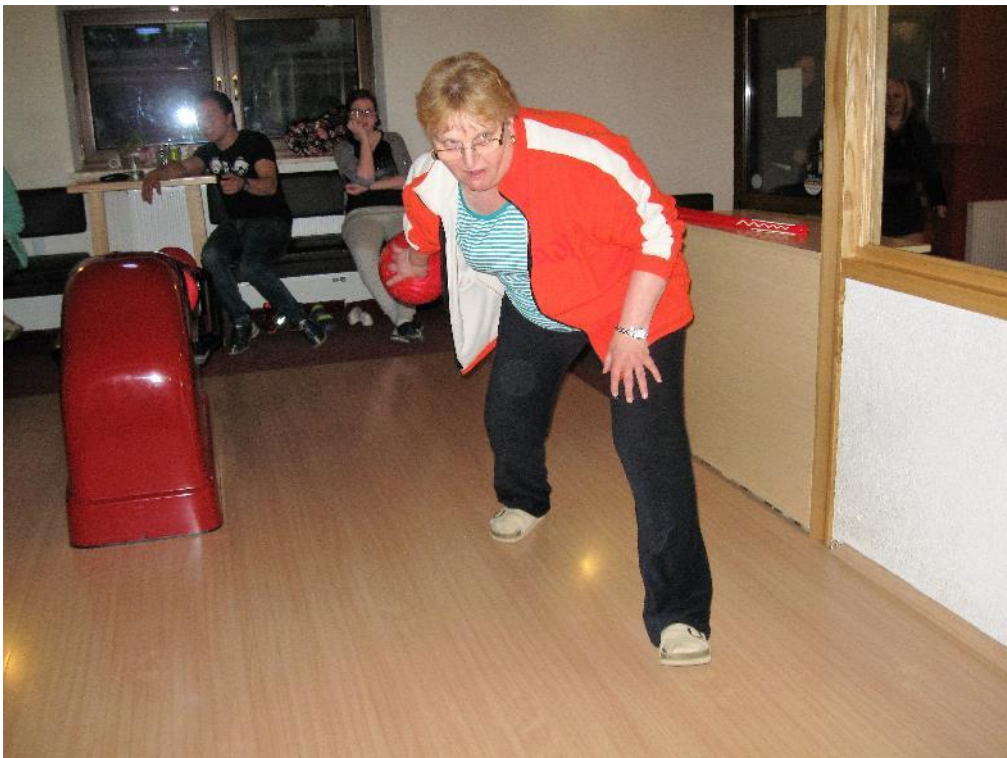
Teto, držíme ti palce