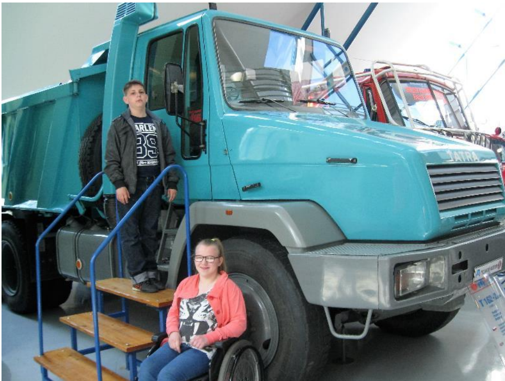
...a opět Tatra...