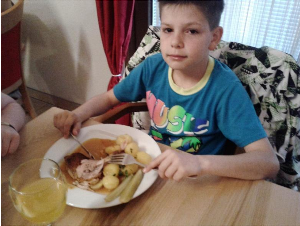
první večeře Silvestrovi chutnala