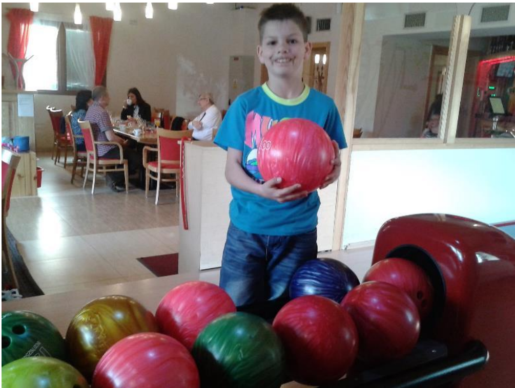
po namáhavém výletu si to rozdáme