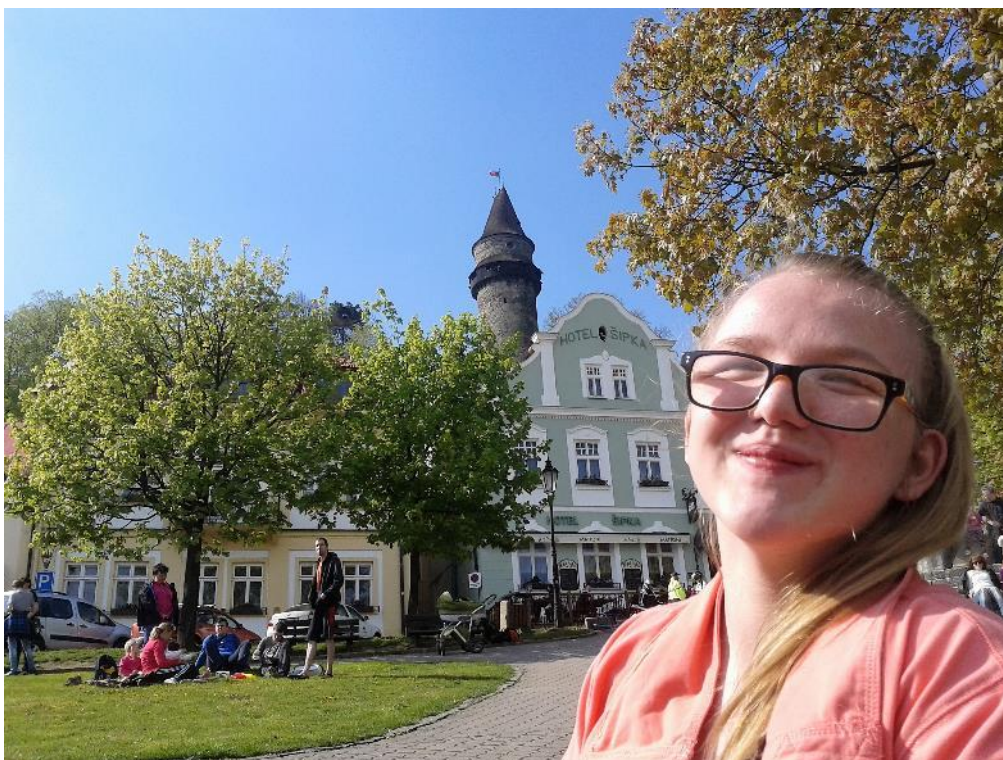
... pozor, změna - Štramberk