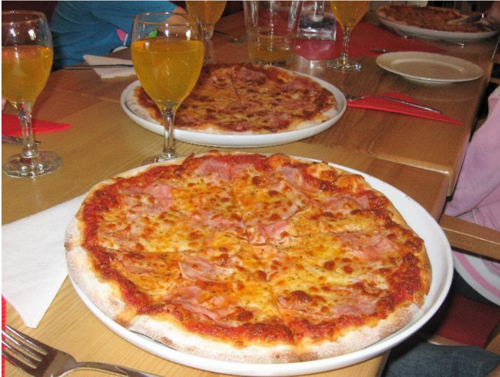
pizza se povedla