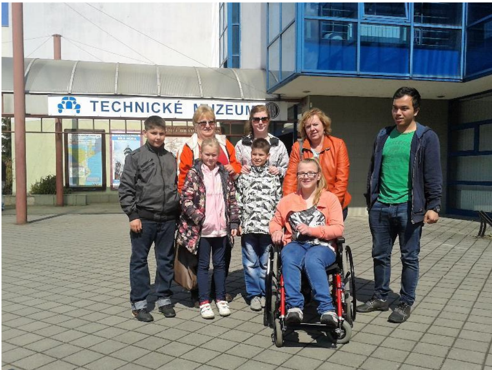
sobotní odpoledne v Kopřivnici