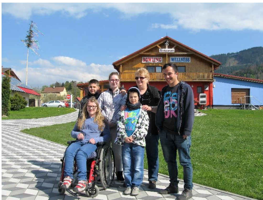
a jsme tady - U Fandy ve Lhotce