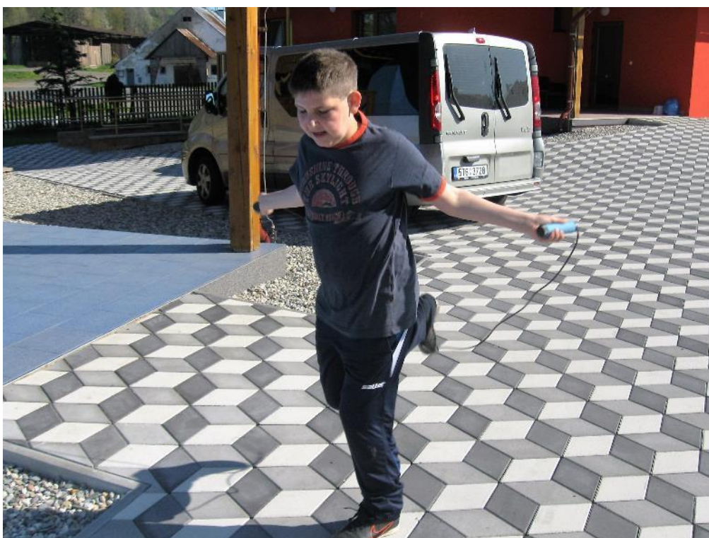
sobotní sportovní dopoledne