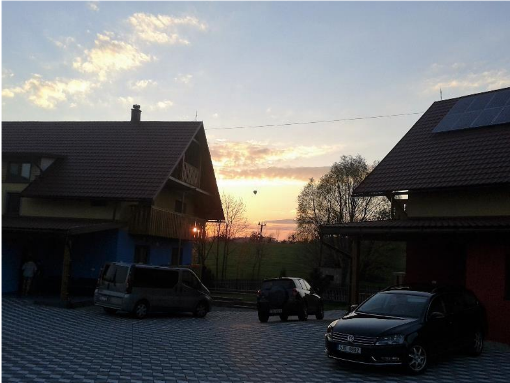
vlevo naše chata, vzadu uprostřed je horkovzdušný balon