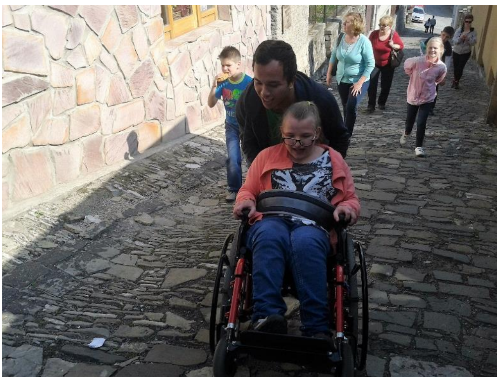
cesta k Trúbě byla dlouhá a strmá